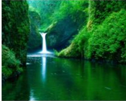
Rysunek 1 - widok 1.

treść treść treść treść treść treść treść treść treść treść treść tre